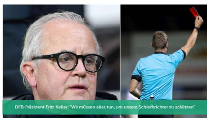
ANGRIFFE AUF SCHIRIS: "DAS MUSS AUFHÖREN!"

! Der VfL verurteilt verbale und körperliche Angriffe auf Schiedsrichter ausdrücklich und lehnt jede Gewalt im Sport ab. Wir rufen die Mitglieder und Fans auf: